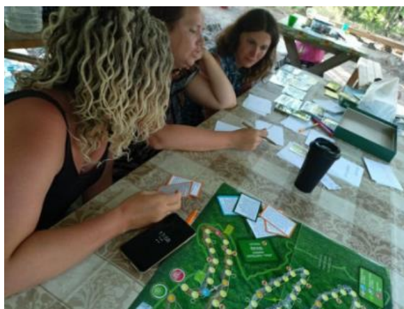
Рис. 13. Мероприятия на территории лагеря

Деятельность в рамках взаимосвязи «человек и человек»