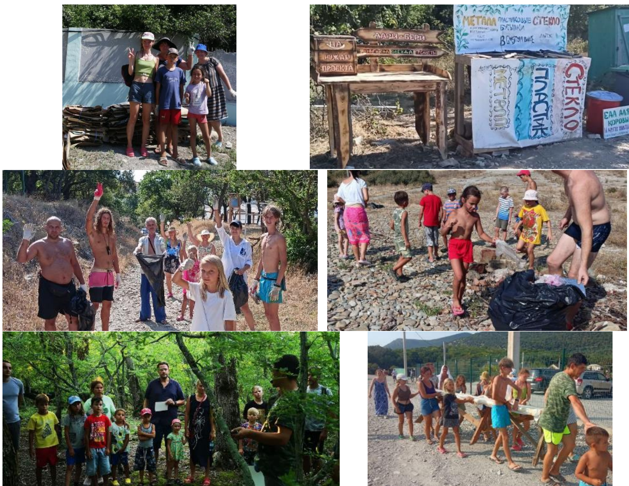
Рис. 25-30. Мероприятия на территории лагеря

Практический уровень. 1. Участие в процессе сбора вторсырья в поселке. 2. Участие в уборках ближайших природных территорий от мусора. 3. Помощь и участие в организации общественных мероприятий: экотурниры, квесты, ярмарки, фестиваль, экодискотека.