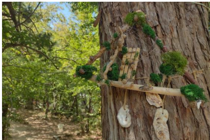
Рис. 11-12. Мероприятия на территории лагеря

Творческий уровень. В этом аспекте мы стараемся не просто украсить лагерь, а сделать что-то неповторимое. При этом природное пространство преобразуется. Мы создаем мандалы, ловцы снов, делаем с детьми красивые оградки, красим камушки для дорожек.