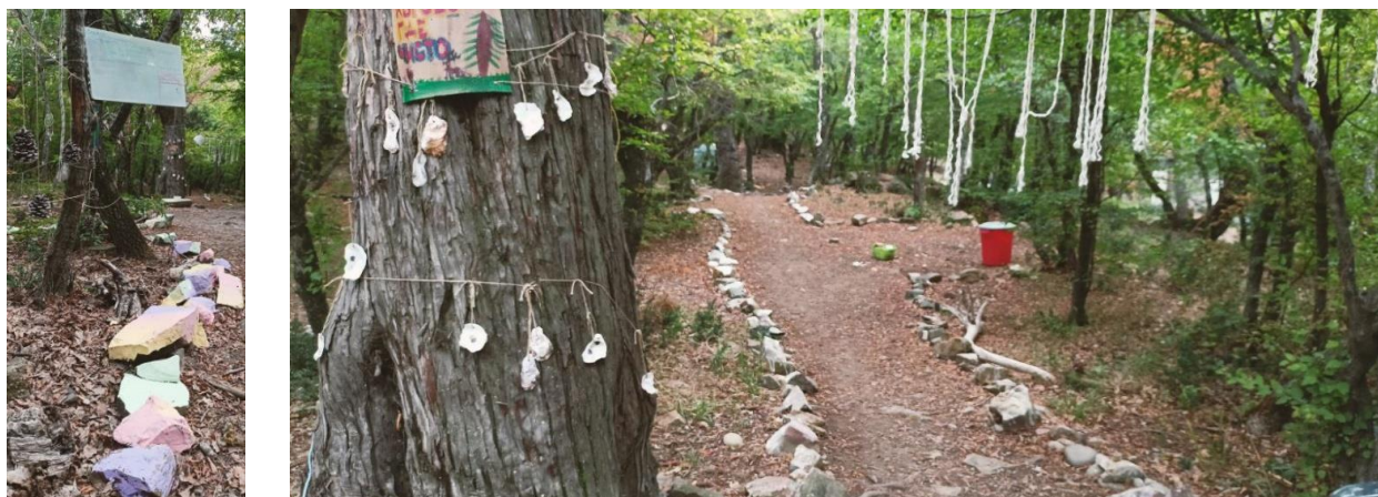
Рис. 3-4. Разметка на территории лагеря

В программу деятельность постоянно вносились меры по снижению антропогенной нагрузки.