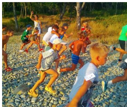
Рис. 16-17. Мероприятия на территории лагеря

Творческий уровень. 1. Создаем спектакль («Дом друзей»), различные мини-клипы. 2. Создаем совместные рисунки, когда все вместе занимаются творческим процессом создания нового. 3. Сюда же относилась деятельность литературного клуба, в результате деятельности которого придумываются сюжеты для квестов.