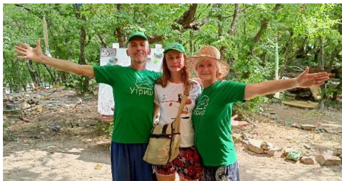
Рис. 14-15. Участники эколагеря «Утриш» в 2022 г.

Для раскрепощения, снятия зажимов проводим актерские и психологические тренинги.