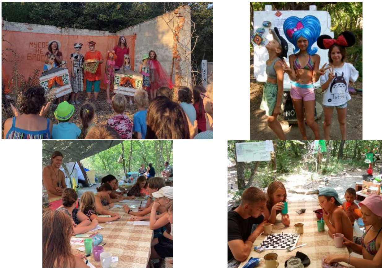
Рис. 18-21. Мероприятия на территории лагеря

Исследовательский уровень. После просмотра фильмов о дружбе, верности, взаимоотношениях: обсуждаем личный опыта детей, связанный с темой фильма; придумываем альтернативный выход; предлагаем применить на практике.