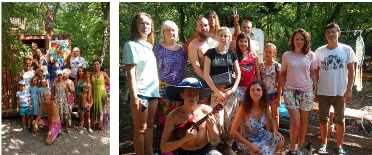
Рис. 1-2. Участники эколагеря «Утриш» в 2022 г.

Основной целью для участников проекта, было получение опыта целостного развития всей своей системы взаимосвязей на всех уровнях, то есть практическое познание природосообразного образа жизни.