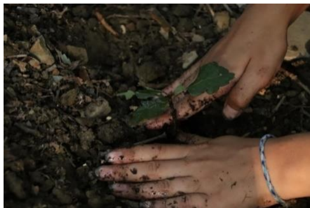
Рис. 9-10. Мероприятия на территории лагеря