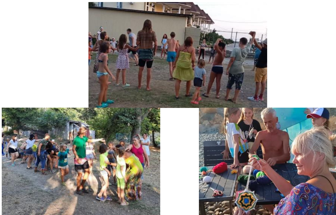
Рис. 31-33. Мероприятия на территории лагеря

и обычаи наших предков. 3. Участие в общественных мероприятиях, требующих выполнения комплекса различных заданий: экотурнир, ярмарка, зарница.