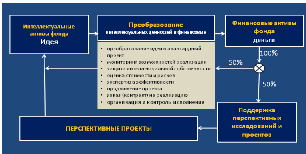
Рис. 3. Схема работы Фонда поддержки перспективных проектов.

В качестве организационного механизма реализации перспективных и прорывных проектов и технологий может быть предложен разработанный в рамках Научной школы устойчивого развития Фонд поддержки перспективных проектов и фундаментальных исследований (рис. 3).